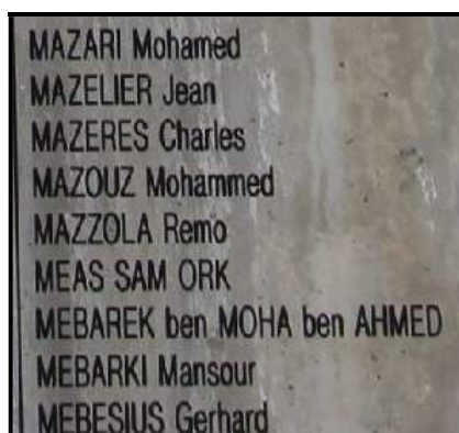
A gauche mémorial des guerres d'Indochine, à droite détail du Mur du Souvenir (Fréjus)