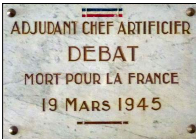
A gauche, portrait d'Albert DEBAT lorsqu'il servait au 5 e Régiment du génie à Satory (1925-28) A droite, plaque à l'entrée de la salle pédagogique munitions des Ecoles Militaires de Bourges