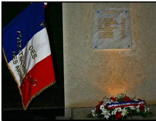
La plaque des artificiers morts pour la France

Divers : décédé en même temps que l'adjudant-chef DEBAT